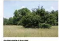
struikengroepjes in hoog gras