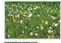
bloemenwilde met bloemenweiden