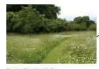
bloemenwilde met graspad door