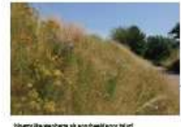
bloemenwilde met graspad voor blauw