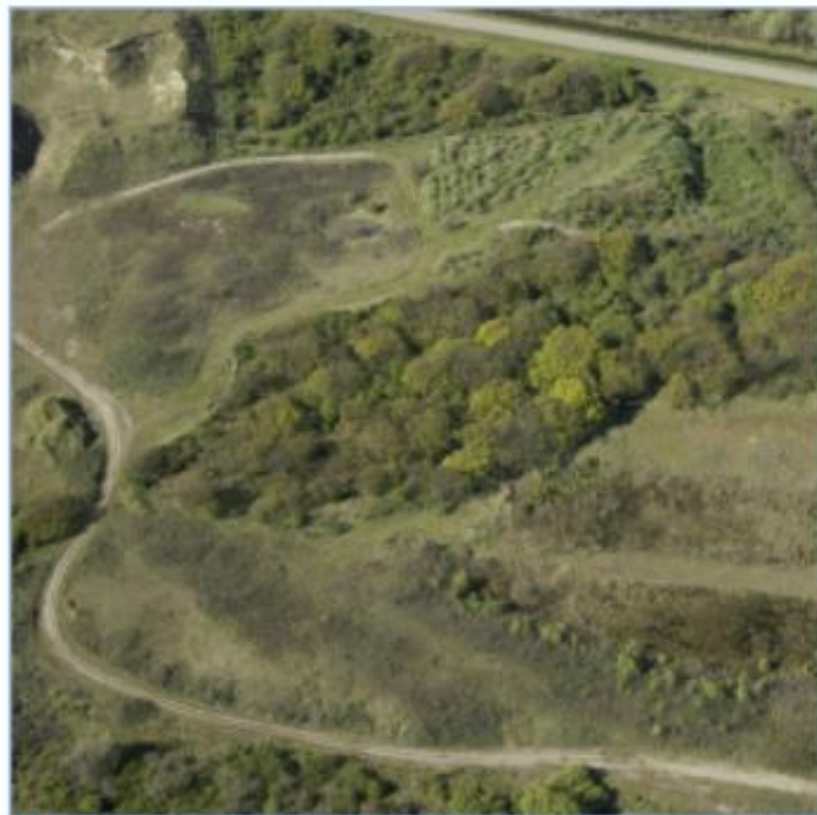
In het grote groengebied - noord zijn al drie biotopen aanwezig.