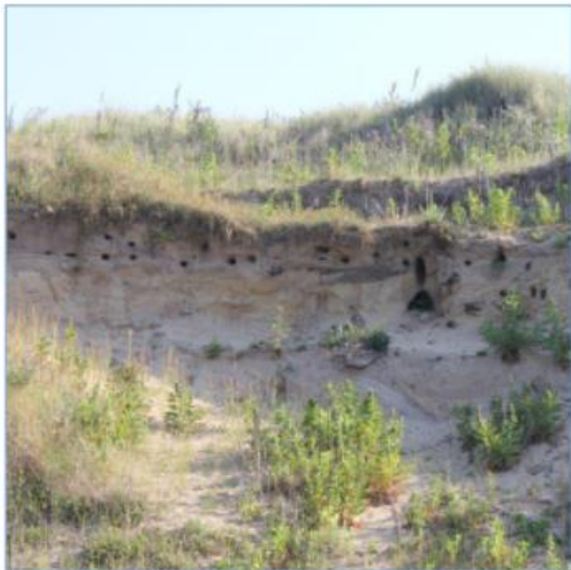
Momenteel is een oeverzwaluwenkolonie gevestigd in dit gebied. Deze kan gehandhaafd blijven en de zwaluwen zullen profiteren van de aanleg van het biotoop 'vochtige duinvallei'.