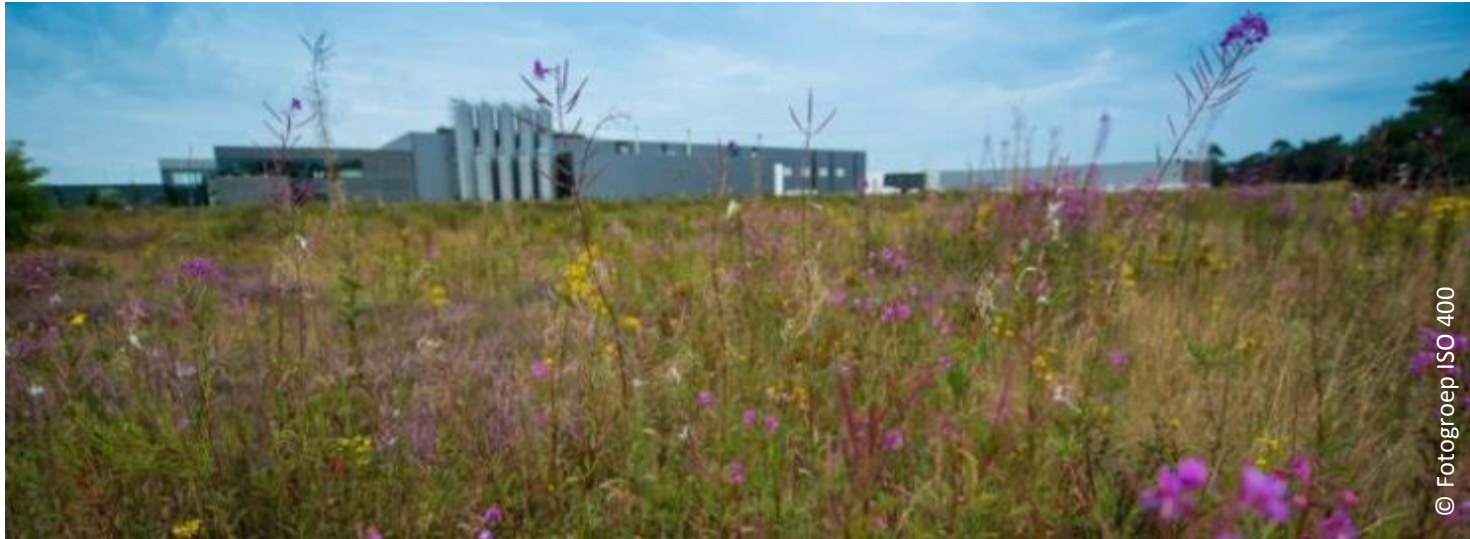
2B Connect Groensafari – Bedrijfsterrein Heineken en Grote Polder Zoeterwoude – 13 juni 2017